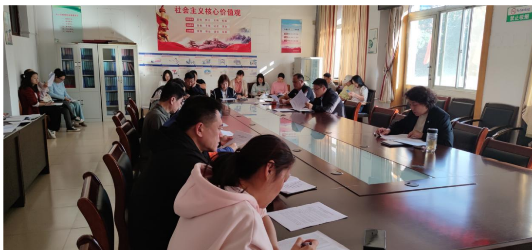
图 1-4 学生心理状况排查活动部署会现场

坚持育心与育德相统一，将心理关爱融入学生成长全过程。开展线上线下多种方式相结合、每学年定期两次、每学期不定期多次的家访活动。本学年暑期大家访围绕学生家庭实际和个人情况，在 13 个教学班内开展，重点关注学生家庭经济状况和心理状态，共计家访 35 人次。开展学生心理状况排查活动，建立“谈话摸排-排查问题学生-学校心理咨询师干预”的排查机制，实现谈话排查全覆盖，做到谈话有记录、问题有解决。此次排查活动共有 494 人参与，共摸排 464 名学生，无心理异常学生。