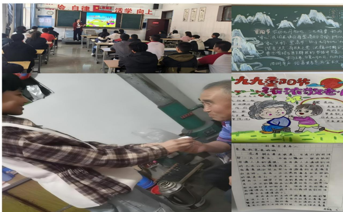
图 1-2 重阳节“敬老爱老”主题系列活动