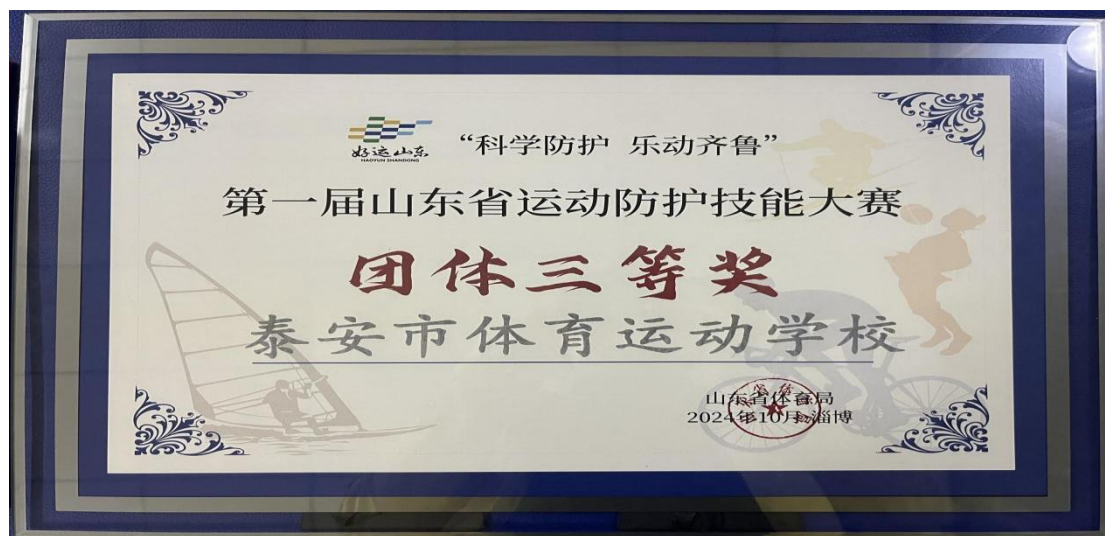
图 1-7 省运动防护大赛团体三等奖

加强学校设施管理、学生生活条件改善、学生管理方式改革，为全校师生创设更加卫生舒适的学习生活环境。学校总务科和保卫科督导，学校物业每日一巡查，对教学楼、宿舍楼、训练馆内的消防设施、饮水设施、管道设施等进行及时排查检修。利用暑假时间，对宿舍进行全面粉刷；全面改善学生生活条件，提高学生就餐标准，由每人每天 30 元提高至 40 元，前三名享受冠军灶 60 元；加强科研康复和反兴奋剂工作，累计治疗伤病运动员 3000 余人次，服务保障 500 余人次，以赛提优，校医疗科研团队积极参加运动防护大赛，在年内省运动防护大赛中荣获团体三等奖、个人优胜奖和优秀组织奖。改革学生管理方式，引进“智慧校园”管理系统，组织举办了为期八天的全校学生军训，试行学生日常行为量化考核，改革原来以队伍为单位的住宿管理模式，实行以班级为单位安排住宿，专职宿管员 24 小时管理服务，提高学生自律自控自管自洁能力。