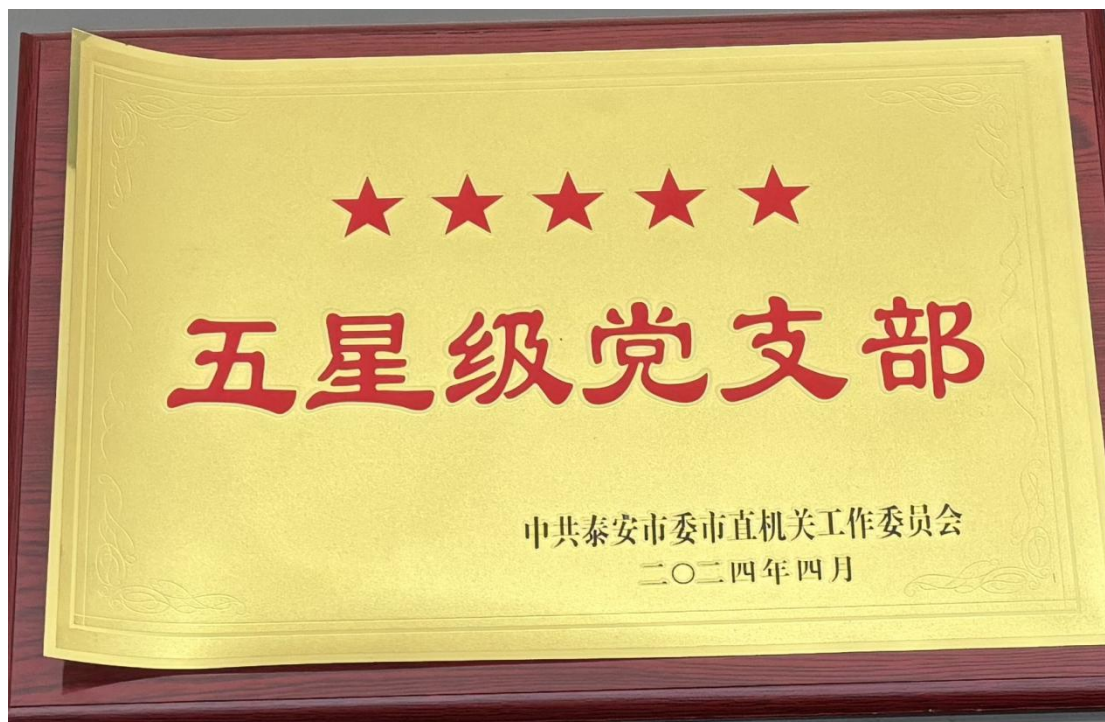
图 2-4 市体校荣获“五星级党支部”称号

26 届省运会全面备战。2023-2025 年是我校省运会备战周期，2024 年是省运会备战的关键一年，学校以强化 26 届备战队伍、夯实训练根基为总目标，以“体能训练做支撑、球类项目打省运、优势项目扛红旗、潜力项目求突破”为任务，精准分析备战形式，发展科学训练内涵，力求训练工作高效有序。通过组建运动防护团队、开展急救技能培训、举办“体医融合”大讲堂培训活动和反兴奋剂教育培训活动、采购专业科研器材，思想教育与科研设备完善相结合，促进科学训练内涵的进一步发展。用好早操、下午、晚上三堂训练课，开展冬训体能大测和运动专项测试，提高训练质量。2025 年是省运会备战的冲刺之年，我校将持续做好队伍备战工作，设