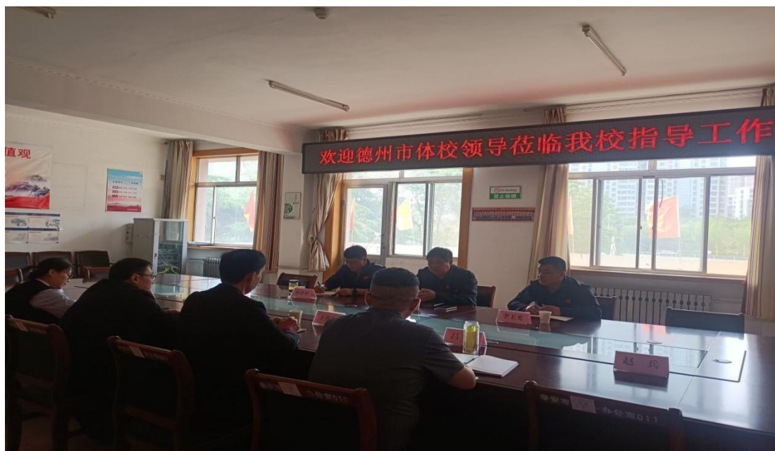
图 3-1 德州市体校来我校学习交流

愿服务活动，抓住学校地域优势，服务赛事承办，配合学校完成社区服务，以实际行动践行奥运精神。“内”“外”结合，加强地域校际交流，与各地市体校运动员切磋交流，实现自我挑战，提升竞技水平。