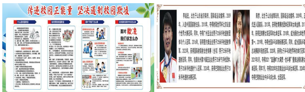
图 1-3 校园文化墙展示