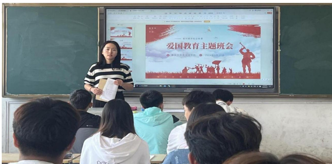
图 1-1 爱国主义教育主题班会

更新校园文化墙，利用优秀运动员模范的力量，进行激励教育，利用规则的力量，进行规范教育，以文化人，促使学生向榜样学习，自觉遵守校规校纪。定期对学生进行感恩教育，在母亲节、父亲节、重阳节、国庆节、中秋节等节日节点通过多种形式进行主题宣传教育活动，让学生懂得感恩。