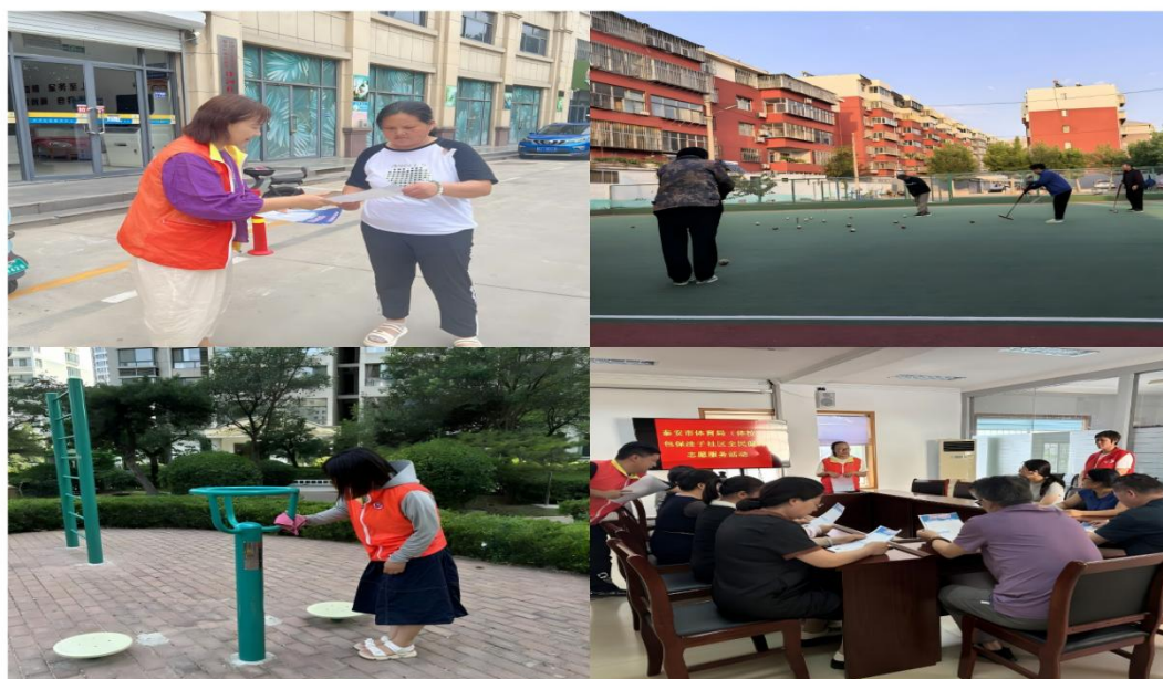
图 2-6 市体校包保社区志愿服务

2024 年，泰安市体校秉承“为国家体育人才培养助力，为体育公共服务尽心”的理念，积极开展体育志愿服务工作，通过协同社区举办简单体育赛事活动、维护社区体育场地设施、做好群众体育健身指导等工作，全校 9 个科室积极参与，每月一次活动，全年累计进行共 100 余次，极大调动了群众的健身热情，满足了群众运动健身需求。