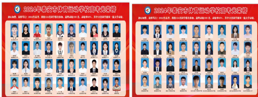
图 1-8 市体校高考光荣榜

2024 年高考，共有 124 人报名参加高考，最终有 88 名同学顺利升学，其中，14 人升入本科。