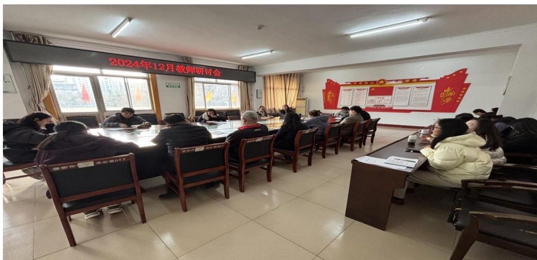
图 5-1 市体校文化课教师例会

壮大教师队伍，提高教育水平。目前学校共有专任教师 88 人，其中专业教师 55 人，公共基础课教师 33 人，35 岁以下教师 28 人，专业教师占专任教师的比例为 62.5%，高级专业技术职务专任教师占比 25%，硕士研究生及以上学历专任教师占比 17%。教师队伍呈现年轻化、高学历化，为我校教育发展持续注入活力。