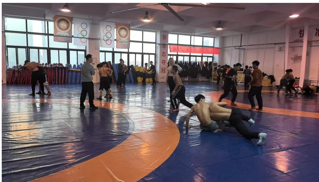
图 2-5 学生日常训练

置个人保底任务、项目金牌任务，以压力促动力，压实教练员责任，强化“金牌至上”意识。推进体教融合，提高合作共建质量，加大输送力度，完善下一届省运会梯队建设。强化训练管理，建立巡查检查制度，有序开展外训交流、省队跟训、委托代训、邀请来训和参加各类比赛，提升运动员夺金能力。加强教练员纪律教育、业务能力培养和比赛规则学习，邀请省队教练来校指导，轮流安排教练员上公开课，督促教练员提高训练掌控和大赛指导能力。强化运动队管理，严格执行训练计划，每月考核，督促训练，提升实力。