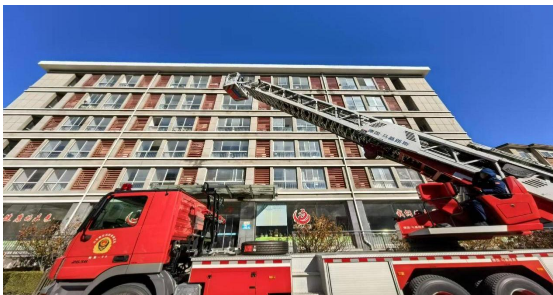
图 1-6 消防应急演练

全员受益。逐步启用“智汇校园”系统，强化学生日常管理，训练科、教务科、保卫科三科协同对学生考勤、住宿、请假等常规工作进行统一管理。加强安全教育，充分利用主题班会、国旗下讲话、演讲、观看专题片等多种形式，传递安全知识，常态化开展治安、交通、反间谍、防火防盗、防诈骗等主题宣传活动，将防意外突发事件融入日常安全宣传教育，做到时时讲安全，刻刻抓安全。加强安全生产管理，强化安全防范，提高“三防”质量。定期开展全校消防、校舍、围墙、设施设备等安全隐患排查，建立隐患台账，限期跟踪整改；聚焦重点领域安全生产工作，加强日常安全生产管理；强化培训教育和应急演练，安保每周开展一次防暴和消防应急演练，组织师生开展应急逃生、防踩踏应急演练，进一步提高师生处置各类突发事件的能力。