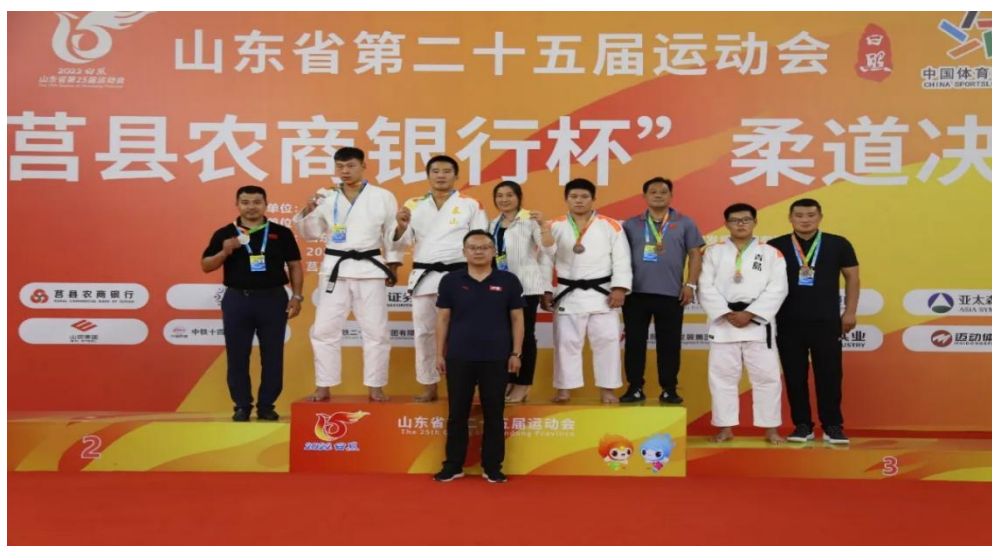
图 2-2 第二十五届省运会柔道冠军

女子橄榄球首次参赛获得乙组第三、甲组第五，取得了突破性成绩。25 届省运会圆满完成了市委、市政府和市体育局确定的目标任务，向全市人民交上了一份合格的答卷。