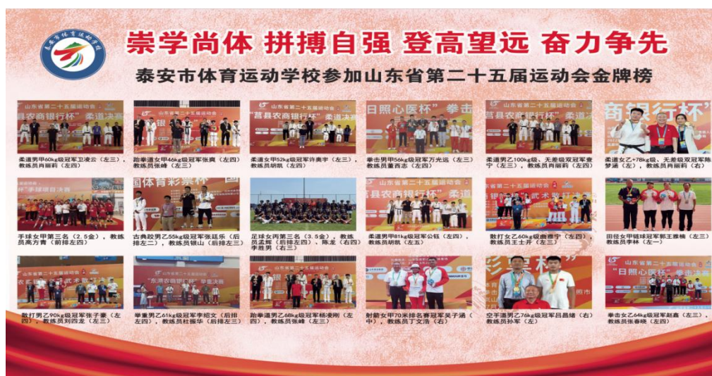
图 2-3 市体校第二十五届省运会金牌榜

由于学校在竞技训练和体教结合方面成绩突出，学校先后获得了“全国群众体育先进单位”“全省群众体育先进单位”“业余训练先进单位”“突出贡献先进单位”“国家高水平后备人才基地”“山东省规范化中等职业学校”“山东省优秀体育