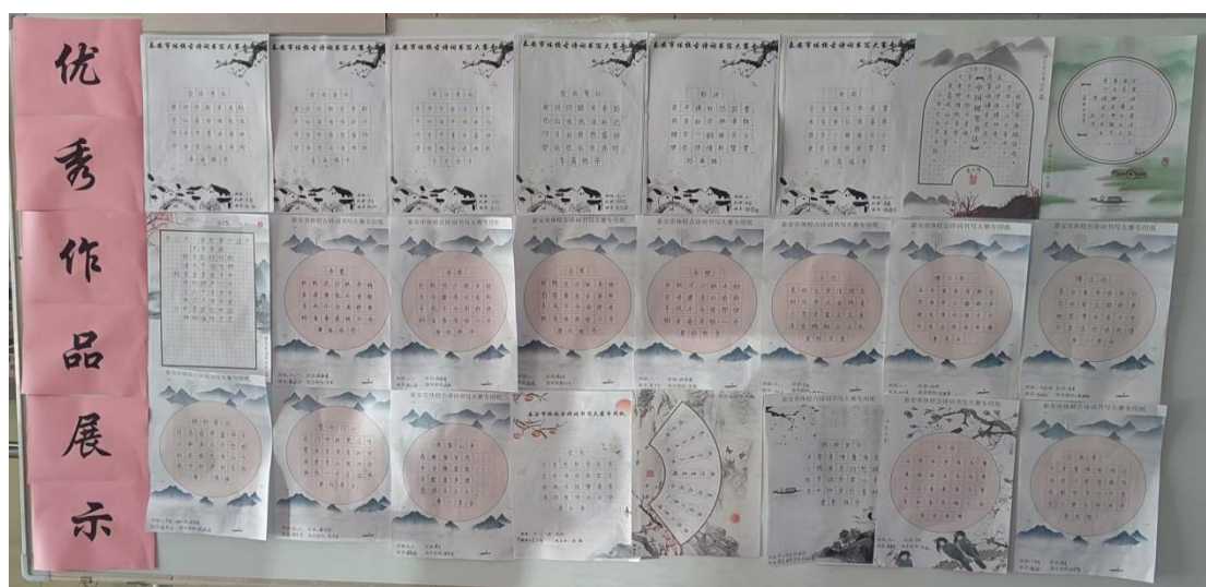
图 3-2 古诗词书写大赛优秀作品展