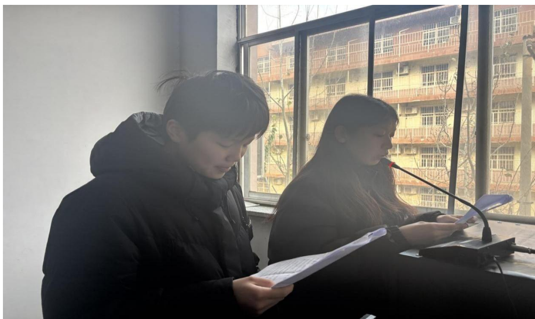
图 1-5 每周校园广播

充分发挥学生社团育人功能，成立学生会，实现学生自治，促进学生全面发展。以学生会为学生自我管理的主要阵地，引导学生积极参与学生纪律卫生管理，参与学校德育实践组织活动，完成从“被动的受管理者”到“主动的参与管理者”的角色转变，提高学生的自我约束力及自我管理能力。